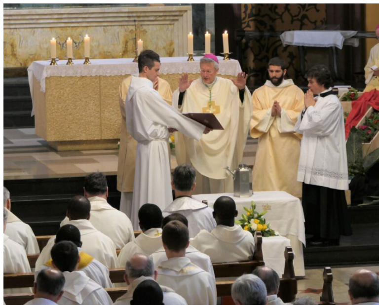
Bénédiction de l'huile des catéchumènes par Mgr Alain de Raemy, le 4 avril 2023 à Neuchâtel