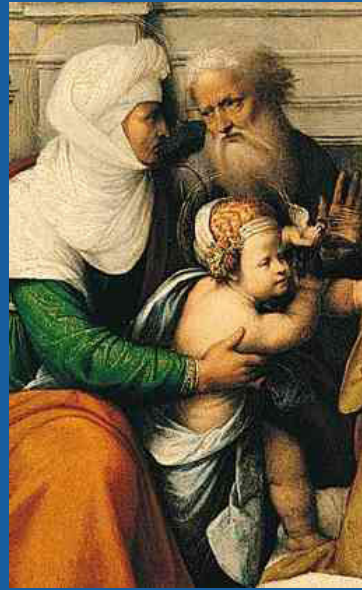
Saint Jean Baptiste, sainte Élisabeth et saint Zacharie (en détail) de Garofalo (vers 1520)

Ce sont les deux parents de Jean-Baptiste. Ils paraissent comme personnages bibliques qui en rappellent à l'amour fidèle, à l'humilité et à la louange du Seigneur. Ils habitaient tout proche de Jérusalem. Ils attachaient leur vie à la vie du Temple. Leur temps avançait au rythme de la vie dans la maison du Seigneur. Ils sont arrivés à un âge très avancé alors qu'ils n'avaient pas encore eu d'enfant. Depuis longtemps ils exprimaient au Seigneur leur désir d'avoir un jour un bébé. Et ils sont restés très obéissants aux commandements de Dieu.