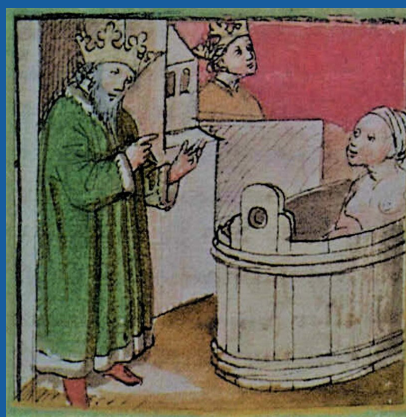
Codex germanicus, 16. Jh.

«In den Augen des HERRN aber war böse, was David getan hatte.»